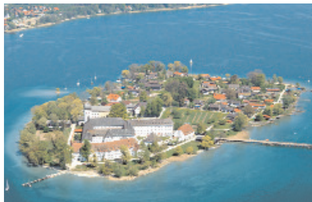
Ihr ungewöhnlicher Tagungsort mitten im Chiemsee

“Wenn Sie mehr passende Azubis wollen, müssen Sie ins Kloster!”